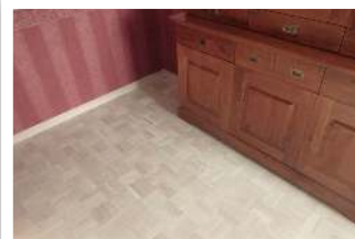
Eiche weiß geölt