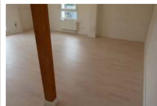
Eiche weiß lackiert